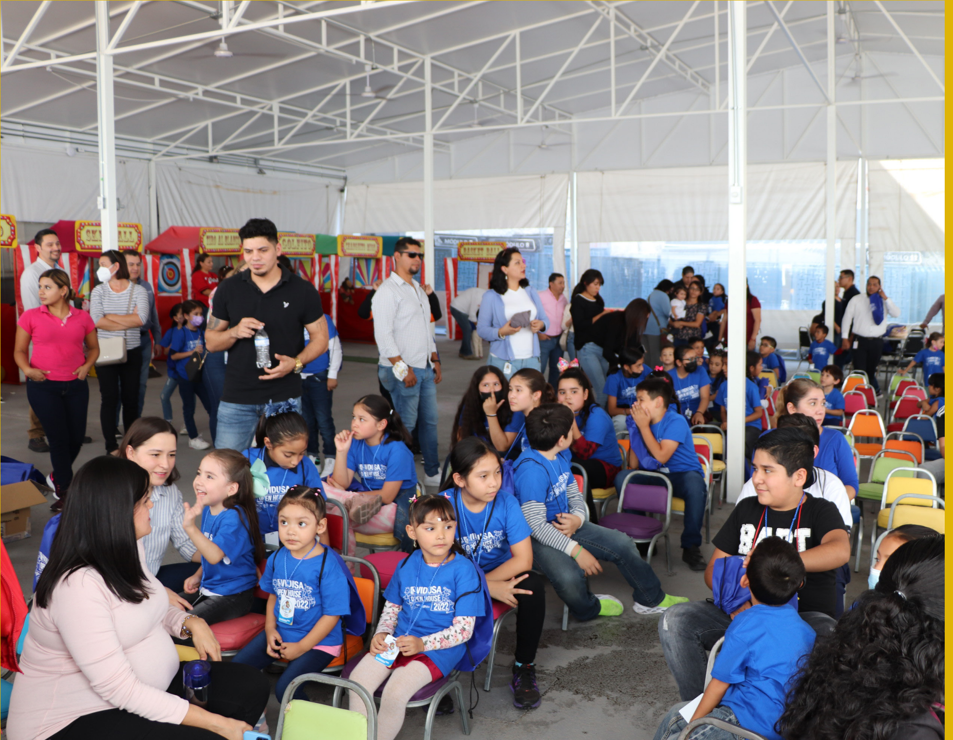
Evento OPEN HOUSE

Por quinta ocasión celebramos el Open House en VIDUSA. Después de dos años de hacer este gran evento virtual, el pasado viernes 21 de octubre se realizó presencial después de la pandemia del COVID-19.