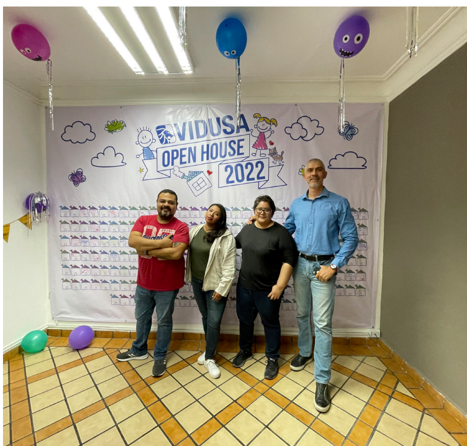
Evento OPEN HOUSE

Aprovechamos para hacer un reconocimiento especial a todas las áreas que hicieron posible este gran evento, a los niños que con su inocencia y curiosidad nos inspiran a vivir la vida de esa misma manera y a VIDUSA por seguir apoyando esta acción.