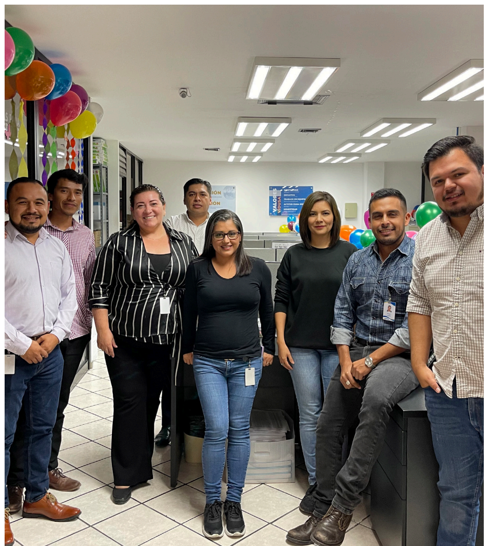
Evento OPEN HOUSE