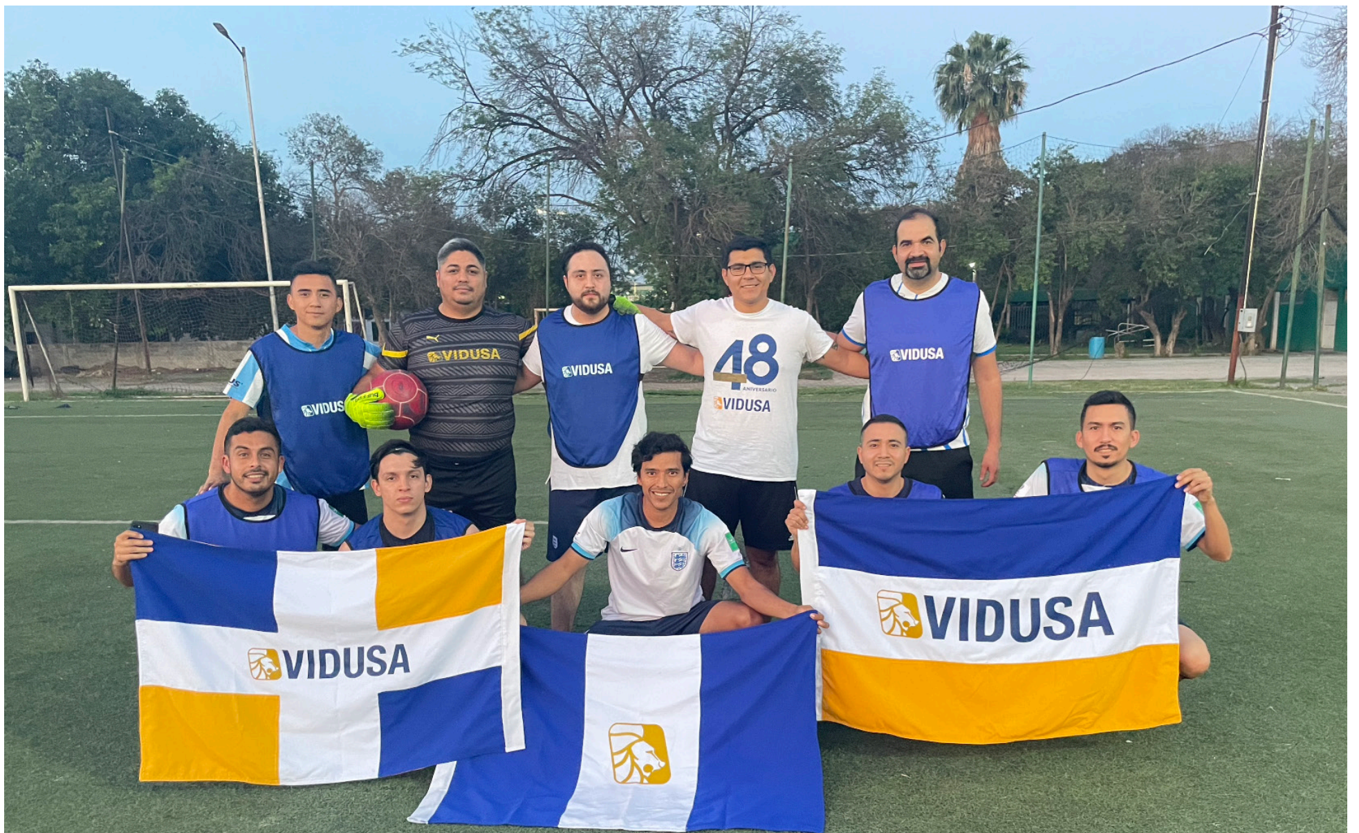
Participantes de la Copa VIDUSA.

La gran final de la Copa VIDUSA estuvo llena de emociones y jugadas memorables, marcando una noche de gran felicidad para el equipo River Plate, quienes se alzaron con la copa del torneo.