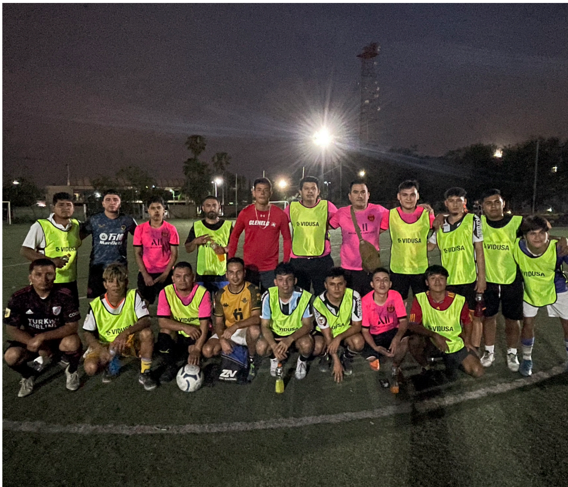
Participantes de la Copa VIDUSA.

El fútbol es un fenómeno social y cultural que ha tenido un rol fundamental en el desarrollo deportivo de los colaboradores de VIDUSA a lo largo de su historia. Mediante este tipo de actividades, se fomenta el valor del trabajo en equipo y la integración de las diferentes áreas de la empresa.